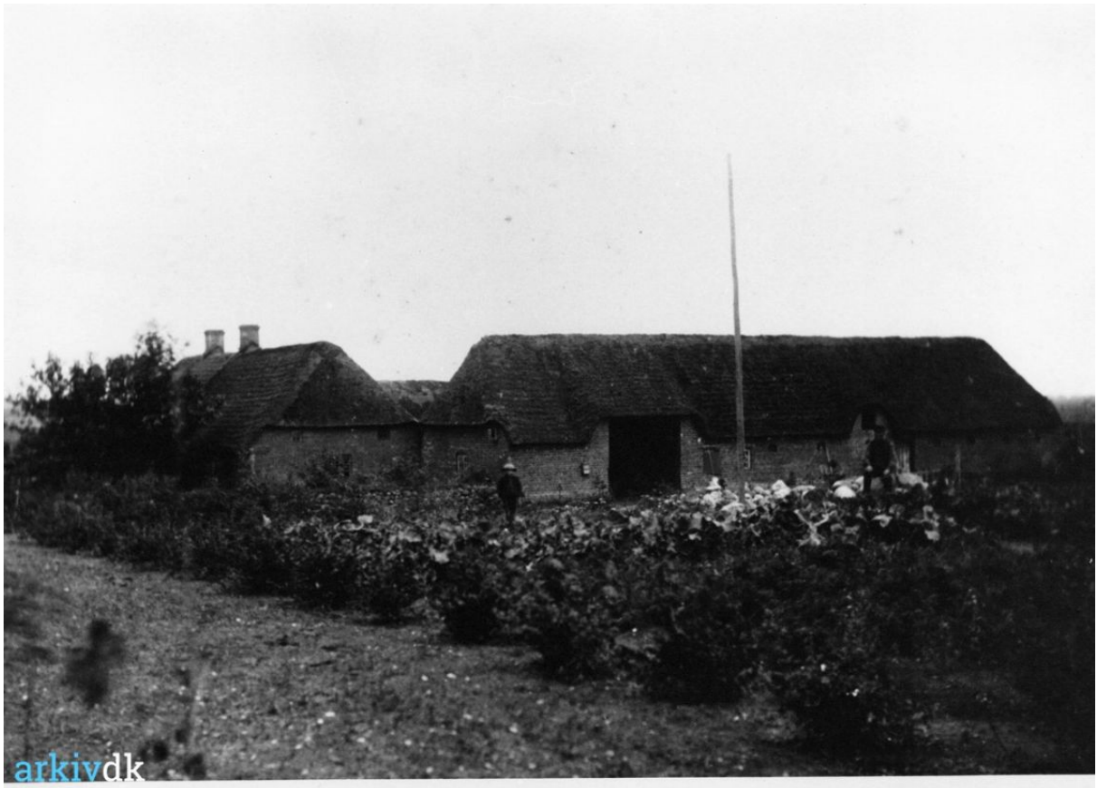
Nedre Bukkjærvej 4