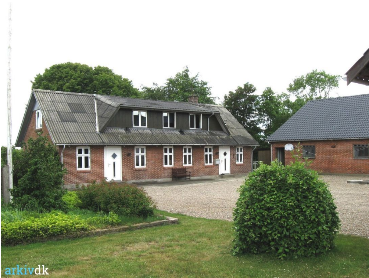
“Meldgaard”, Nedre Bukkjærvej 5, Kibæk